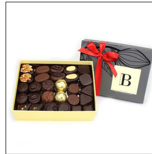
BALLOTINS Taille 3 Poids : environ 540 g Prix : 58 €