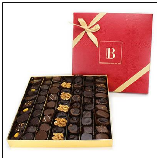
CARRÉ Taille 2 Poids : environ 600 g Prix : 84 €