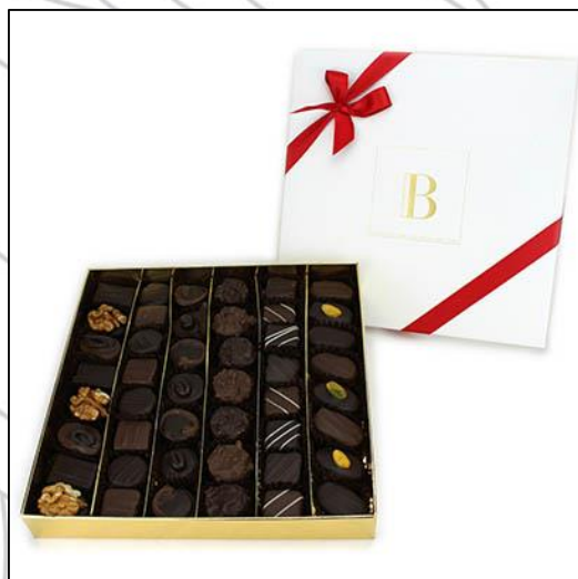
CARRÉ Taille 1 Poids : environ 500 g Prix : 64 €