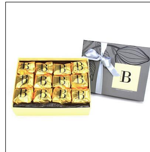
MARRONS Taille 3 26 marrons glacés Prix : 80 €