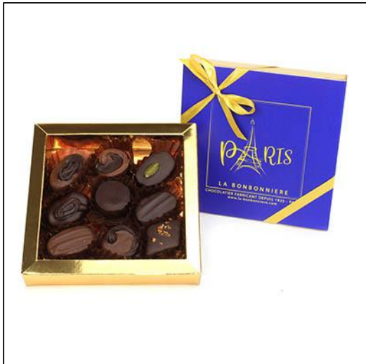
BOÎTE PARIS TOUR EIFFEL 9 chocolats Prix : 13,50 €