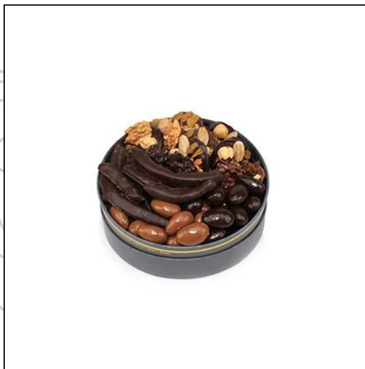
COFFRET BARBIZON Taille 1 Poids : environ 300 g Prix : 39 €