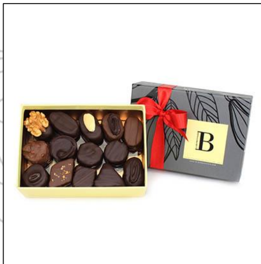
BALLOTINS Taille 1 Poids : environ 280 g Prix : 30 €