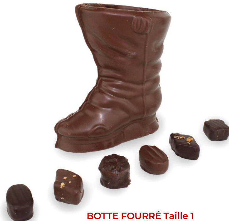
BOTTE FOURRÉ Taille 1 Prix : 18 €