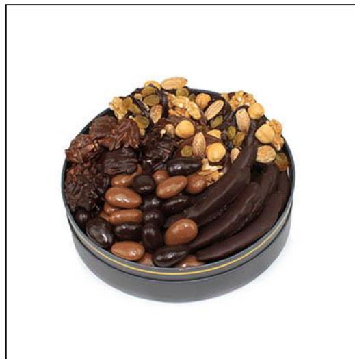
COFFRET BARBIZON Taille 2 Poids : environ 450 g Prix : 54 €