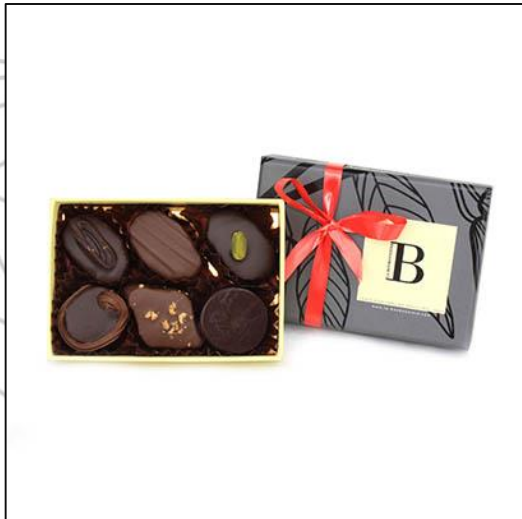
BALLOTINS Taille 0 6 chocolats Prix : 9,50 €