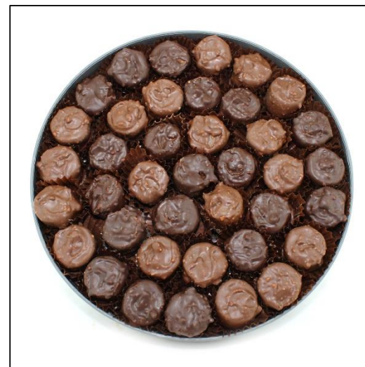
COFFRET ROCHERS Pralinés Taille 3 Poids : environ 500 g Prix : 69 €