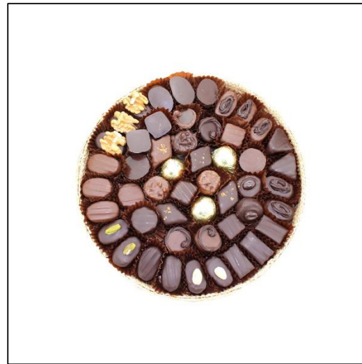
PANIER Taille 4 Poids : environ 520 g Prix : 77 €