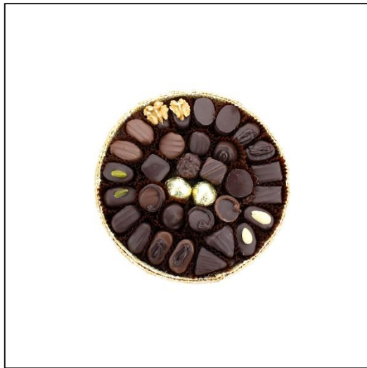
PANIER Taille 2 Poids : environ 350 g Prix : 56 €