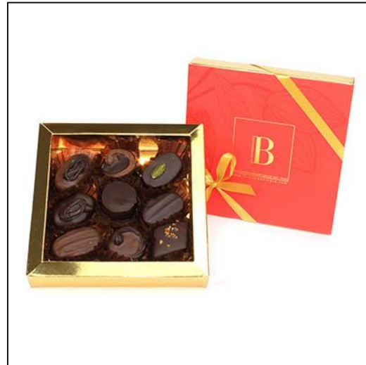
BOÎTE MAISON ROUGE 9 9 chocolats Prix : 13,50 €