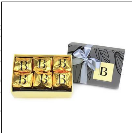
MARRONS Taille 1 12 marrons glacés Prix : 39 €