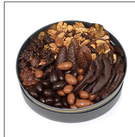
COFFRET BARBIZON Taille 3 Poids : environ 600 g Prix : 69 €