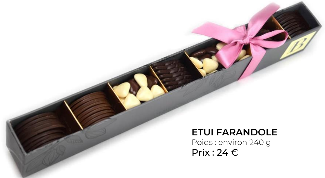
ETUI FARANDOLE Poids : environ 240 g Prix : 24 €