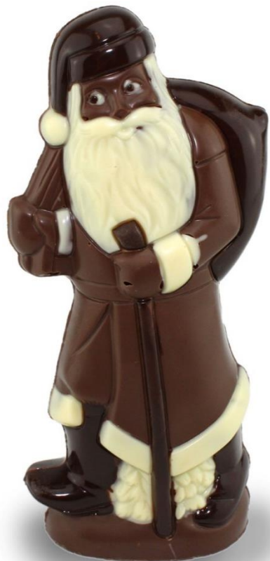
PÈRE NOËL Taille 1 Prix : 14,50 €