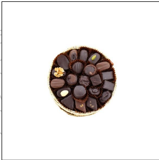
PANIER Taille 1 Poids : environ 210 g Prix : 36 €