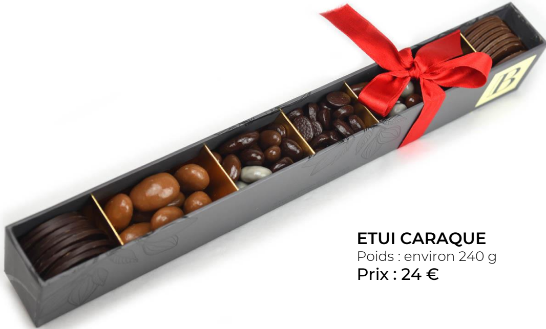
ETUI CARAQUE Poids : environ 240 g Prix : 24 €