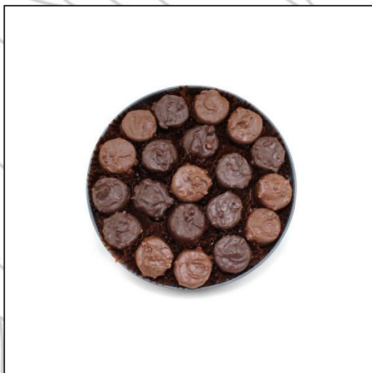
COFFRET ROCHERS Pralinés Taille 1 Poids : environ 250 g Prix : 39 €