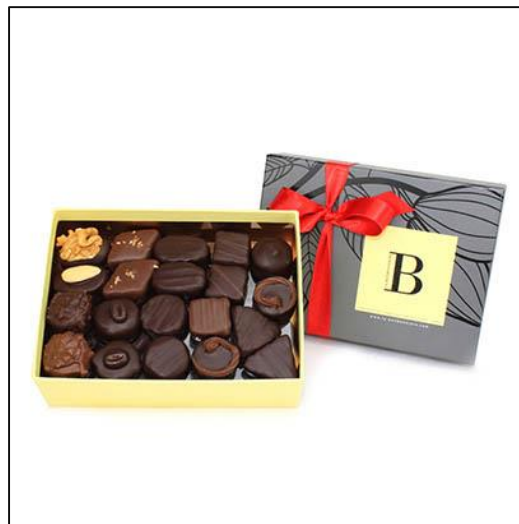
BALLOTINS Taille 2 Poids : environ 395 g Prix : 42 €