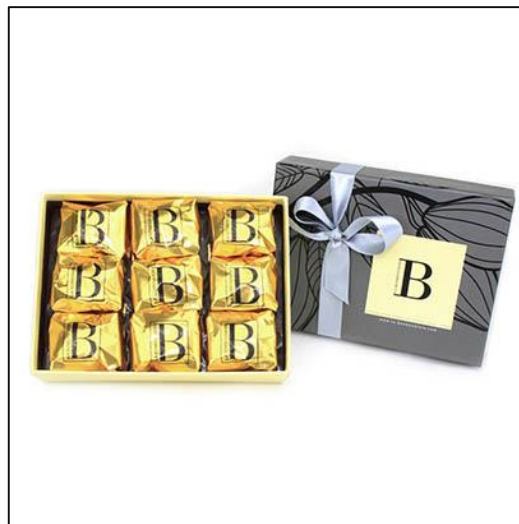
MARRONS Taille 2 20 marrons glacés Prix : 63 €