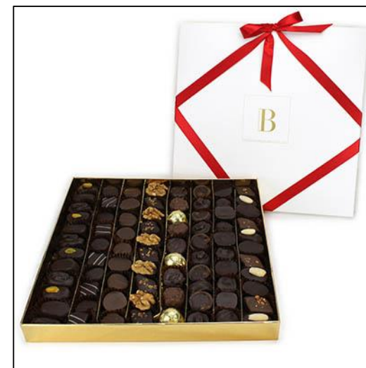
CARRÉ Taille 3 Poids : environ 800 g Prix : 103 €