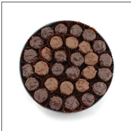
COFFRET ROCHERS Pralinés Taille 2 Poids : environ 360g Prix : 53 €